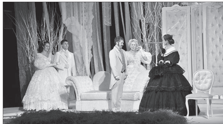
Нацтеатр Удмуртии, «Отцы и дети»