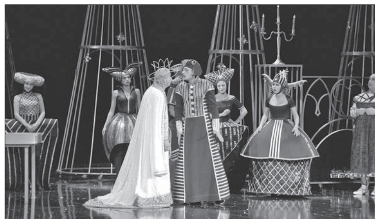
ГРДТ, «Обыкновенное чудо»